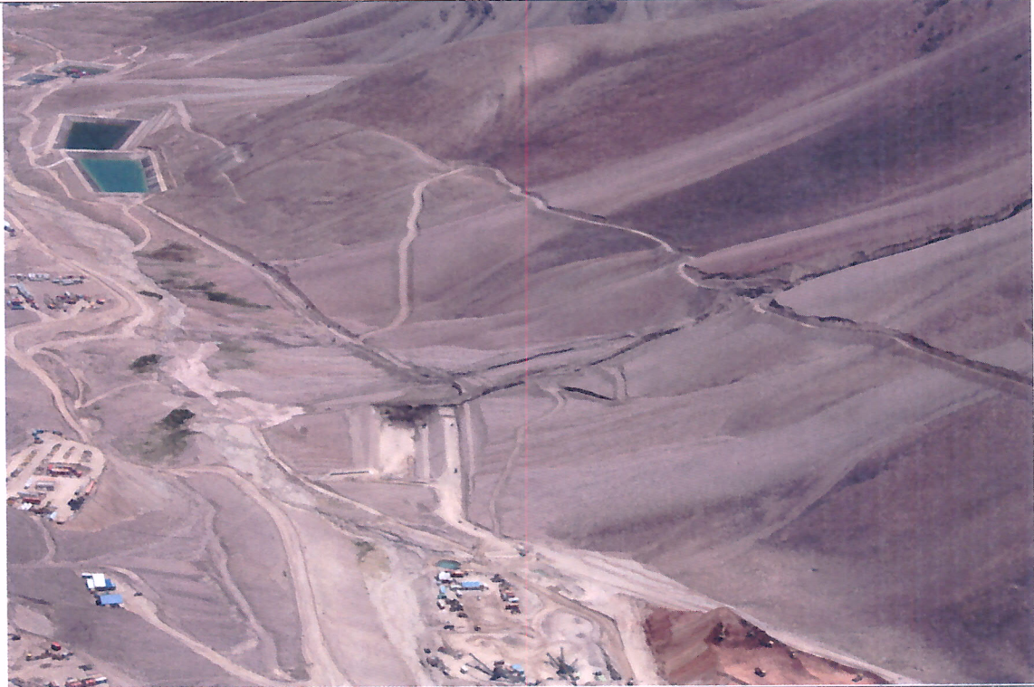
Foto N°5, Zona de alud de coluvios evacuación de aguas canal perimetral Norte.