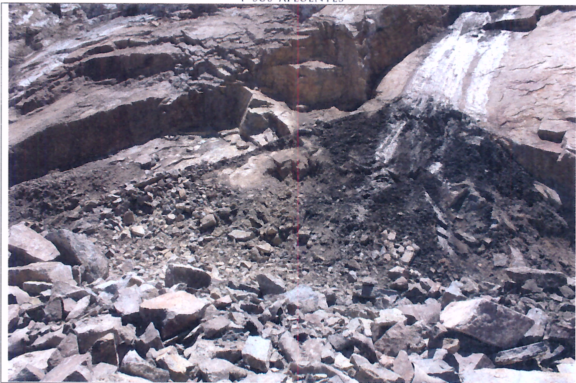
Foto N°4, Derrumbe de coluvio sobre Canal Perimetral Norte Inferior